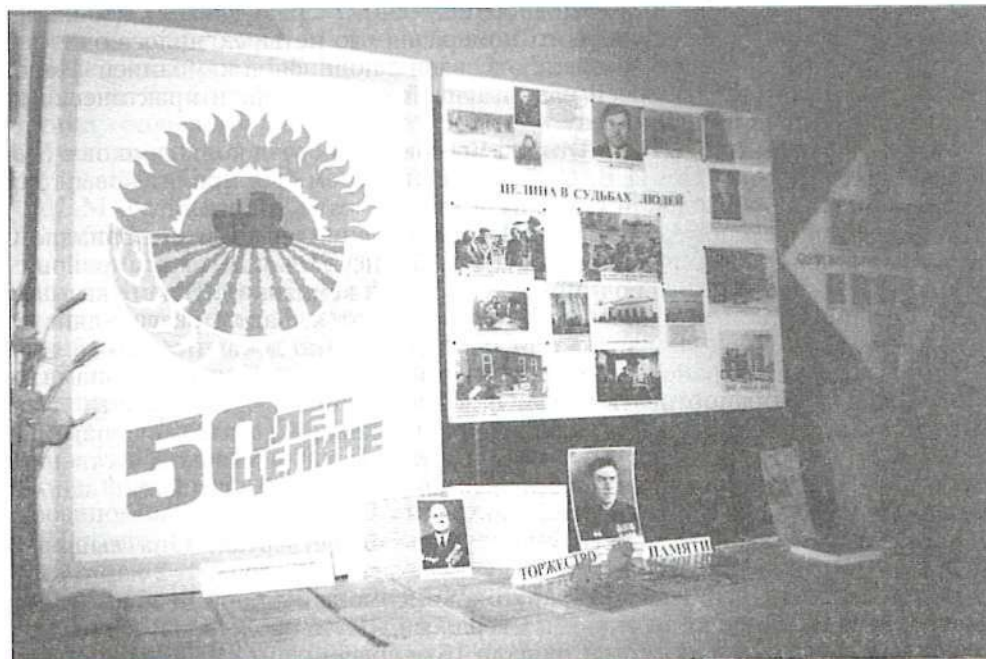
Выставка «50 лет целине», подготовленная архивным отделом администрации Кулундинского района и районным музеем, размещенная в РДК с. Кулунда. 9 апреля 2004 г.

Архивный отдел подготавливает инициативные информации по документам, находящимся в архивном отделе, и направляет в организации и учреждения, организывает выставки, работает с исследователями. Архивный отдел посещают ученики и учителя школ, студенты, работники редакции, специалисты учреждений и организаций. С 2004 года студенты исторических факультетов университетов края проходят практику в архивном отделе. И интерес к архивным документам растет с каждым годом.